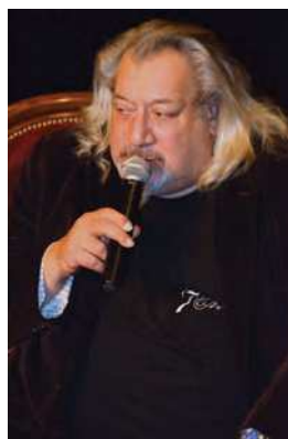
Jean-Claude Dreyfus reçu au théâtre de Pézenas en Janvier 2013.

Les Amis de Pézenas avaient reçu Jean-Claude Dreyfus, le comédien qui incarnait le personnage du boucher, un rôle qui le rendit populaire. « Si je devais être critique sur ma carrière, je donnerais les films les plus emblématiques pour moi : Bien évidemment les films de Jean-Pierre Jeunet et Marc Caro » (Ma bio dégradable)