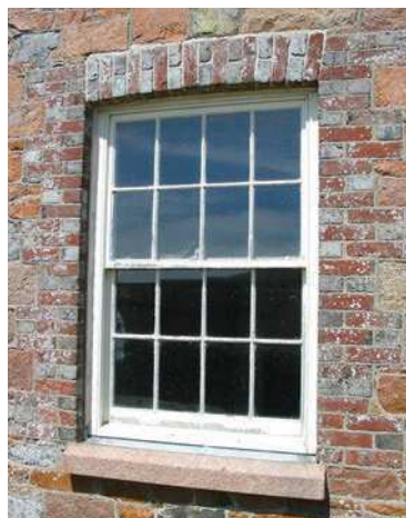
Fenêtre à guillotine Anglaise.