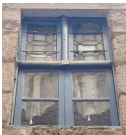
Fenêtre XVII e rue Canabasserie.