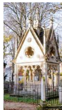
Tombeau d'Abélard et Héloïse.