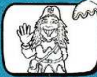
JACOBUS Steenvoorde - Hauts-de-France