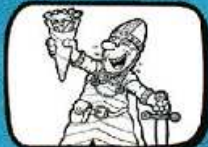
BEAUDOIN IV Ath - Hainaut