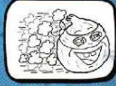
le POIS CHICHE Montaren - Occitanie