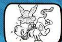
le MULET Valros - Occitanie