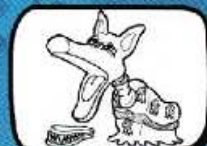
le LOUP Loupian - Occitanie