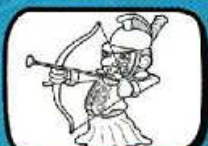
TIRANT l'Ancien Ath - Hainaut