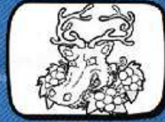
le CERF Servian - Occitanie