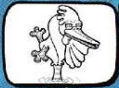
le PÉLICAN Puisserguier - Occitanie