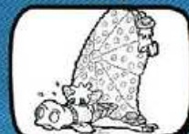
lo CHIVALET Florensac - Occitanie