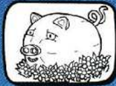
le COCHON Poussan - Occitanie