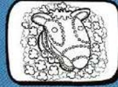
lo TESTUT Montblanc - Occitanie