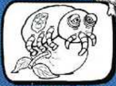
le RYNCHITE Pomèrols - Occitanie