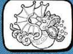
DRAC de l'Agrupació Vilafranca del Penedès - Catalunya