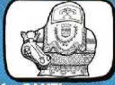
lo CAMEL Béziers - Occitanie