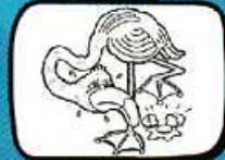
le FLAMANT BO Mireval - Occitanie