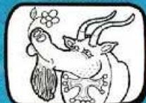
le BOUC Paulhan - Occitanie