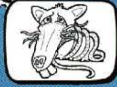
le RAT MUS Gabrian - Occitanie