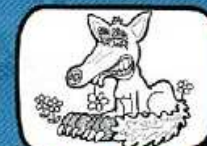
la RENARDE Fontès - Occitanie à PATTES NOIRES