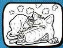
le LOUP et la FÉE Castelnaud de Guers - Occitanie