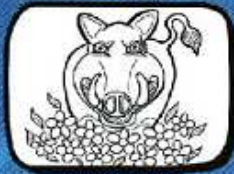
le SANGLIER Varages - Provence