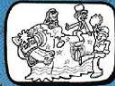
lo POLIN Pézenas - Occitanie