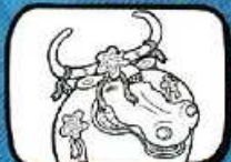
le BŒUF Meze - Occitanie