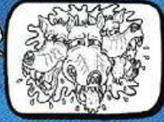
TRIBVS LYPIS Cournonterral - Occitanie