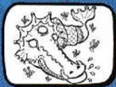
lo DRAC La Salvetat sur Agout - Occitanie