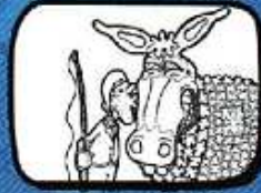
l'ÂNE Bessan - Occitanie