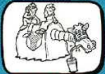
le POULAIN Alignan du Vent - Occitanie