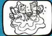
lo CHIVALET Pézenas - Occitanie