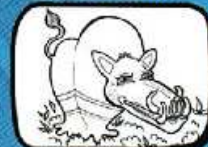
le VEYDRAC Villevéyrac - Occitanie