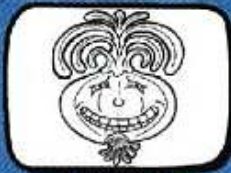
l'OIGNON Lézignan la Cèbe - Occitanie