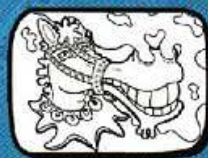
la MULASSA Barcelona - Catalunya