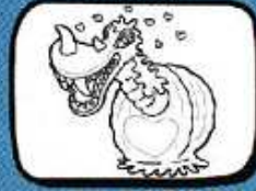
la BARAGOGNE Saint-Christol - Occitanie