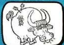
lo BIÒU Portiragnes - Occitanie