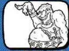
BOCA NEGRA Santa Maria del Camí - Mallorca