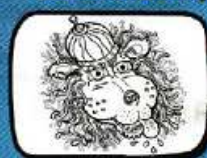
el LLEÓ Barcelona - Catalunya