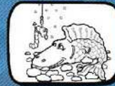
la LOCHE Nizas - Occitanie