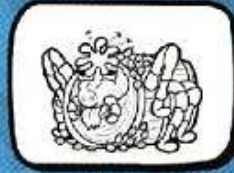
le POU Conas - Occitanie