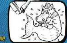
le CHEVAL MARIN Agde - Occitanie