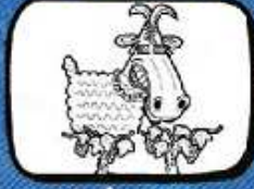
la CHÈVRE Montagnac - Occitanie